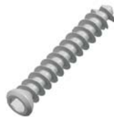
4.0 мм Губчатый винт с частичной нарезкой