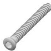
3.5 мм Кортикальный винт самонарезной